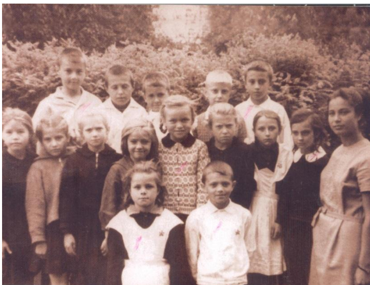
Дети-поляки, узники Освенцима.

И. Менгеле, групповые фотографии со встречи Узников Освенцима в Московской консерватории в 1967 году, копия уникальной фотографии детей-узников после освобождения, фотография на память о встрече в