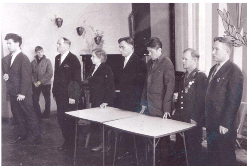
Выступление на встрече узников перед студентами Московской консерватории. «Бухенвальдский набат». 04.01.1967 г.

В 1950–60-е годы в музее Истории и археологии Урала действовала секция бывших узников концлагерей, от которой сохранились воспоминания и личные вещи людей, пострадавших в нацистских застенках.